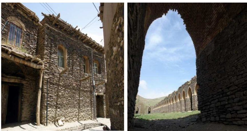
شکل (۲) نمایی از روستای ورکانه

واریزه‌های دامنه‌ای می‌باشد. در شکل (۲ و ۳) تصاویر نمونه‌هایی از این مکان‌ها مشاهده می‌شود.