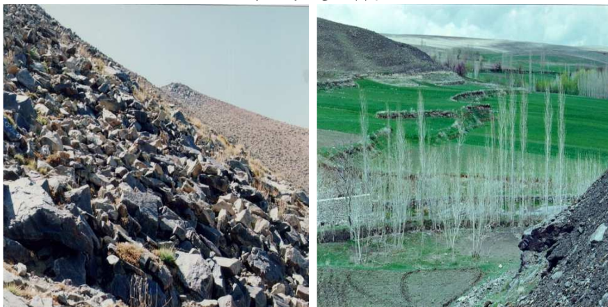
شکل (۴) واریزه‌های دامنه‌ای