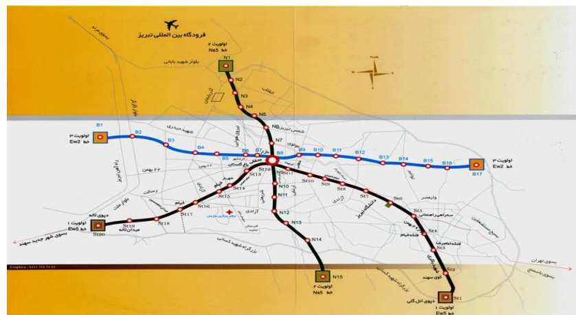
شکل (۲) خطوط قطار شهر تبریز