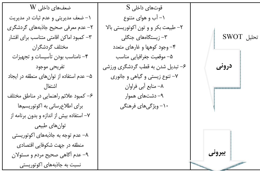
جدول (۷) تدوین نقاط استراتژیک توسعه اکوتوریسم کرمانشاه

با تداخل هر یک از عوامل بر یکدیگر، به تدوین راهبردهای مختلف رقابتی / تهاجمی (SO)، تنوع (ST)، بازنگری (WO) و بالاخره راهبردهای تدافعی (WT) پرداخته شد. (جدول ۷):