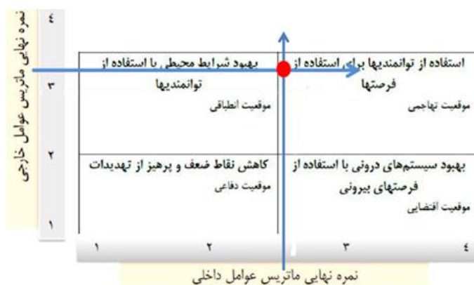
شکل (۲): نمره نهایی ماتریس عوامل خارجی و داخلی

امتیاز نهایی از ضرب ضریب در رتبه به دست می آید. جمع نمره نهایی از ۱ تا ۱/۹۹ نشان دهنده ضعف داخلی سیستم است. نمره ها از ۲ تا ۲/۹۹ نشان دهنده وضعیت متوسط سیستم و نمره های ۳ تا ۴ بیانگر این است که سیستم در وضعیت عالی قرار دارد (ترکمن نیا و همکاران، ۱۳۹۰: ۹۱)