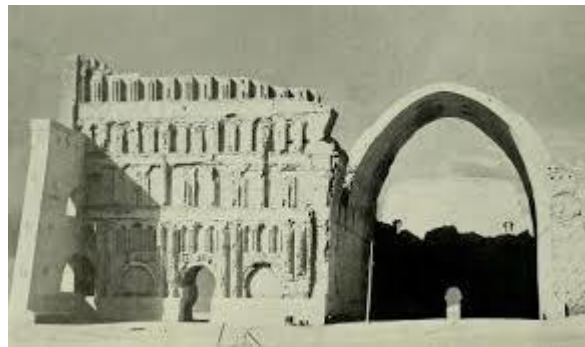
قدیمی ترین تصویر عکاسی شده از طاق کسری ۱۹۸۶ میلادی

این ایوان بلندی تقریبی ۳۰ متر و پهنایی نزدیک به ۴۳ متر دارد. ارتفاع نمای عمارت زمانی به ۷ متر بلندتر از ارتفاع طاق می‌رسید (پوپ، ۱۹۳۰: ۵۴).