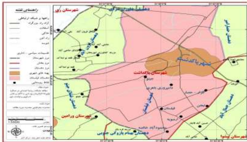
نقشه شماره ۱: موقعیت جغرافیایی روستاهای دهستان فیلیستان در شهرستان پاکدشت

شهرستان پاکدشت با وسعتی معادل ۶۱۰ کیلومتر مربع، حدود ۳/۲ درصد از مساحت استان تهران را به خود اختصاص داده و با ارتفاع ۱۰۱۳ متر از سطح دریا در زمین‌های آبرفتی جنوب رشته‌کوه‌های البرز قرار گرفته است. این دهستان، در بخش مرکزی شهرستان پاکدشت واقع شده و شامل روستاهای فیلیستان، جیتو، ارمبویه، گلزار (گلزار بالا و پایین)، جمال آباد و محمودآباد خالصه و دو روستای زیر ۲۰ خانوار تیجن و دامپروری باهری است. جمعیت و خانوار روستاها در جدول شماره ۴ ارائه شده است. فعالیت اصلی روستائیان در این دهستان، کشاورزی و به‌ویژه کشت گلخانه‌ای و کشت گل و گیاهان زینتی است که نسبت به سایر دهستان‌های شهرستان پاکدشت از سطح توسعه مطلوب‌تری برخوردار است.