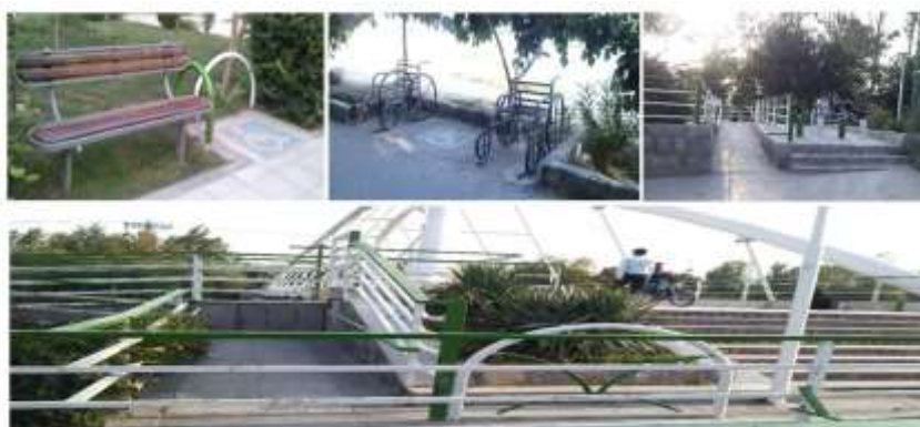
شکل (۴): خدمات دسترسی معلولان در پارک

و کاهش آلودگی هوا را به دنبال دارد. با وجود فضاهای پارکینگ طراحی شده در حاشیه پارک همچنان مراجعه‌کنندگان با مشکل عدم فضای کافی برای پارکینگ خودروها و ایجاد ترافیک در روزهای تعطیل مواجه هستند. این مشکل به دلیل عدم پشتیبانی سیستم حمل-ونقل عمومی در تأمین دسترسی مردم به این محدوده ایجاد شده است. در صورت فراهم شدن زیرساخت‌های مناسب ارتباطی بخشی از مراجعه‌کنندگان با خودروی شخصی کاسته شده و امکان مراجعه و استفاده از فضای سبز برای افرادی که توان رانندگی را ندارند، نظیر کودکان، سالخوردگان و حتی بانوان فراهم خواهد شد. در خصوص دسترسی کودکان معلول به پارک اقدامات مناسبی در تأمین زیرساخت‌ها فراهم شده از جمله در ورودی‌های پارک و وجود رمپ‌های تخصصی عبور ویلچر و یا مکان‌های استراحت که نمونه‌ای از آن در شکل (۱) ارائه شده است: