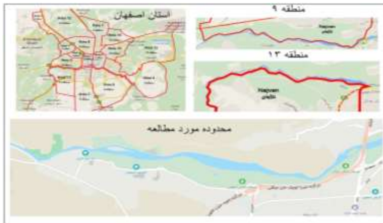
شکل (۱): موقعیت جغرافیایی محدوده مورد بررسی

در جوامع با حجم نامعلوم محاسبه و حجم نمونه ۳۸۴ خانوار تعیین گردید که شامل ۲۰۰ کودک و ۱۸۴ بزرگسال است که مورد پرسشگری قرار گرفتند. محدوده مورد مطالعه بخشی از حاشیه زاینده‌رود در حوزه پارک نازوان و مرز بین مناطق ۹ و ۱۳ شهر اصفهان، حدفاصل پل وحید تا باغ پرندگان در هر دو سوی شمالی و جنوبی رودخانه است که نقشه (۱) محدوده مورد بررسی را نشان می‌دهد. برای جمع‌آوری داده‌ها از پرسشنامه محقق‌ساخت استفاده شد که روایی آن توسط اساتید برنامه‌ریزی شهری مورد تأیید قرار گرفت و پایایی با استفاده از ضریب آلفای کرون باخ به صورت پیش‌آزمون (۳۰ پرسشنامه) بررسی شد که مقدار آلفای محاسبه شده ۰/۸۹ حاکی از پایایی پرسشنامه است. برای سنجش متغیرها از طیف لیکرت پنج سطحی استفاده شد، با حضور محقق در محل، انجام مشاهده و مصاحبه با افراد حاضر در پارک پرسشنامه‌ها تکمیل گردید و نتایج با استفاده از نرم‌افزار SPSS مورد تحلیل و ارزیابی قرار گرفت.