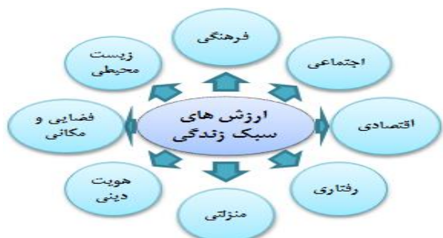
شکل (۲) مدل تحلیلی پژوهش (سبک زندگی)