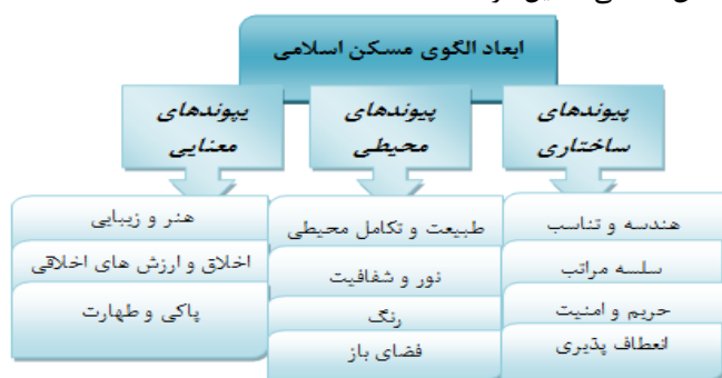
شکل (۱) مدل تحلیلی پژوهش (الگوی مسکن اسلامی)

در خصوص بررسی شاخص‌های سبک زندگی، تعداد ۳۹ گویه با ۸ شاخص آشکار را در قالب ارزش‌های فرهنگی (۵ گویه)، ارزش‌های اجتماعی (۹ گویه)، ارزش‌های اقتصادی (۵ گویه)، ارزش‌های زیست‌محیطی (۴ گویه)، ارزش‌های فضایی و مکانی (۴ گویه)، ارزش‌های هویت دینی (۴ گویه)، ارزش‌های منزلتی (۴ گویه)، ارزش‌های الگوی رفتاری فردی و جمعی (۴ گویه) مدنظر قرار داده‌ایم و در خصوص بررسی شاخص‌های الگوی مسکن اسلامی در قالب ۳ مؤلفه پیوندهای ساختاری (با ۴ شاخص و ۱۸ گویه)، پیوندهای معنایی (با ۳ شاخص و ۱۲ گویه)، پیوندهای محیطی (با ۴ شاخص و ۱۴ گویه) مورد بررسی قرار می‌گیرد تا ارتباط بین ارزش‌های سبک زندگی و الگوی مسکن اسلامی تحلیل گردد.