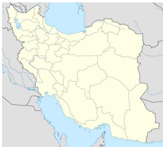
شکل (۱). نقشه منطقه مورد مطالعه