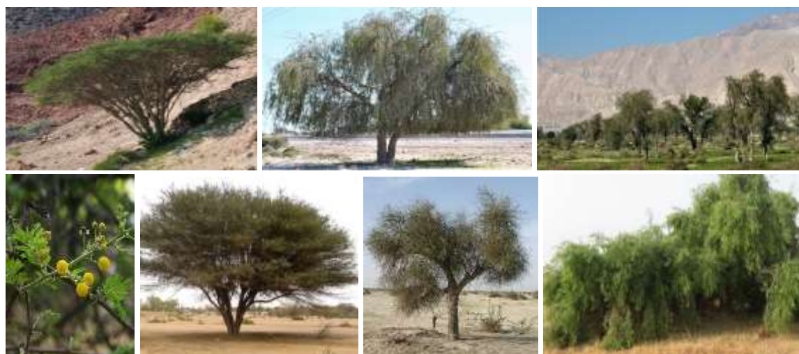
شکل (۲). برخی گونه‌های درختی ناحیه خلیجی - عمانی. از راست به چپ و بالا به پایین: درختزار کهور ایرانی، تک پایه کهور ایرانی، آکاسیای چتری، چوج، کلیر، تچ، گل‌اذین کرت