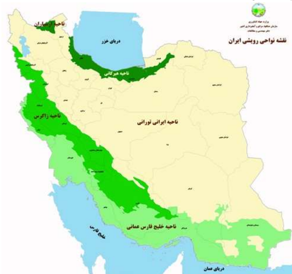
شکل (۱). نواحی رویشی ایران

شکل ۱، موقعیت ناحیه رویشی خلیجی - عمانی را در ایران نشان می‌دهد. این ناحیه رویشی، بخش‌های جلگه‌ای جنوب غرب و غربی ایران، مشرف به خلیج فارس و دریای عمان، از استان ایلام در غرب تا سیستان و بلوچستان در جنوب شرق را در بر می‌گیرد. عناصر جنگلی این ناحیه رویشی، به صورت پراکنده، گاهی کم پشت و گاهی متراکم، در جنوب استان‌های خوزستان، بوشهر، هرمزگان و سیستان و بلوچستان و همچنین جزایر خلیج فارس دیده می‌شود. اقلیم این ناحیه، خشک گرمسیری (نیمه استوایی) بوده و فاقد یخبندان است.