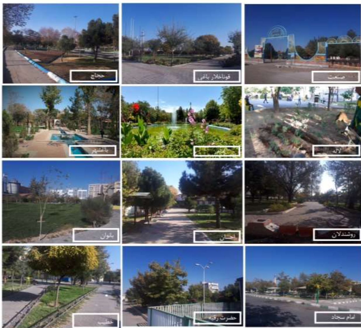
شکل ۳: فضاهای سبز مورد مطالعه (نگارندگان، ۱۴۰۲)