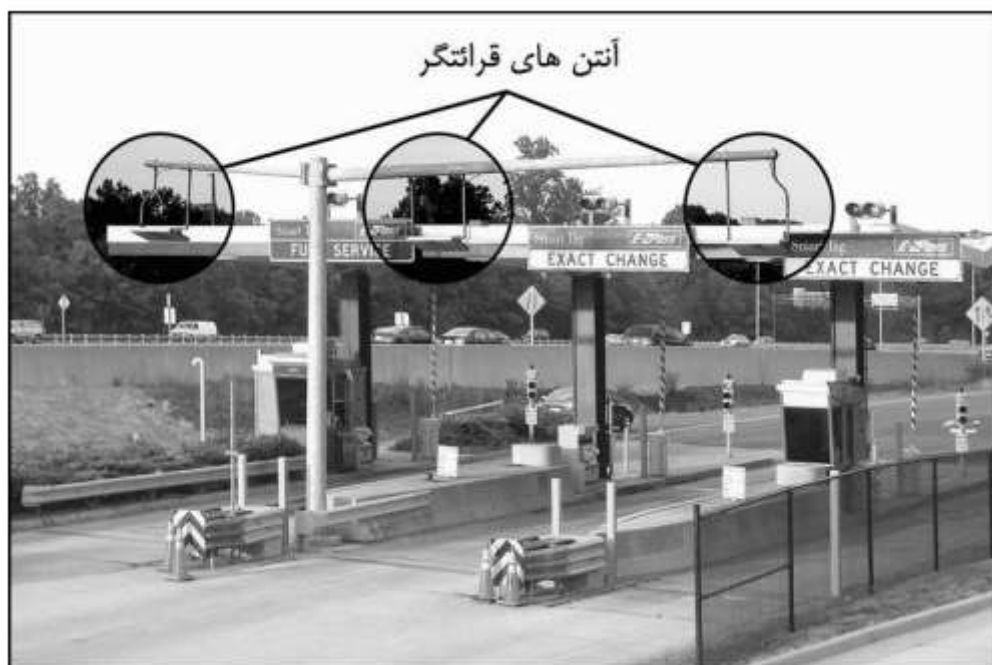
شکل (۱). چگونگی شناسایی خودرو برای اخذ عوارض بصورت الکترونیکی و خودکار

روش نسبت به سیستم دستی دقت بالاتر، اطمینان بیشتر از عدم سوءاستفاده و تبانی، نیاز کمتر به نیروی انسانی آموزش دیده و بتبع آن هزینه نگهداری کمتر دارد که در آینده کاربرد این طرح در حوزه‌های کنترل محدوده طرح ترافیک و طرح اضطرار، کنترل عدم خروج تاکسی‌ها از محدوده شهر، کنترل سرعت ناوگان حمل و نقل عمومی (اتوبوس‌ها، مسافربرهای سواری بین شهری، کامیون‌ها و...) و نیز پرداخت عوارض بزرگراه‌ها متصور است. اخذ عوارض جاده‌ای یا پارکینگ، از استفاده‌های معمول برچسب‌های هوشمند است که در صنعت حمل و نقل نمود برجسته‌ای خواهد داشت. کنترل تردد خودروها به پارکینگ‌های عمومی یا خصوصی، تنها با نصب یک برچسب بر شیشه خودرو، امکان شناسایی خودکار توسط برچسب خوان تعبیه شده در نزدیکی درب ورود یا خروج و باز شدن راه بند را ضمن ثبت زمان پرداخت می‌کند. همچنین در ورودی بزرگراه‌ها نیز رانندگان می‌توانند بدون توقف یا کاهش محسوس سرعت، عوارض براساس اطلاعات برچسب نصب شده بر شیشه‌ی خودرو خود پرداخت نمایند. شکل ۱ بیانگر یک پیاده‌سازی از این مورد است. در سیستم پرداخت عوارض، معمولاً از برچسب‌های غیرفعال قابل برنامه‌ریزی با فرکانس بین ۸۶۵ تا ۹۱۵ مگا هرتز که مانند کاغذ و بدون نیاز به باتری قابل نصب روی شیشه جلوی اتومبیل است، استفاده می‌شود.