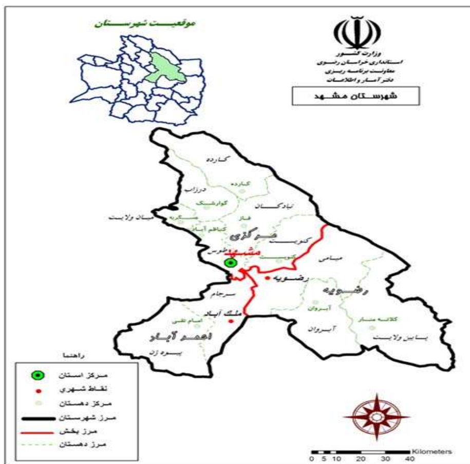
شکل (۴). نقشه شهرستان مشهد-۱۴۰۱