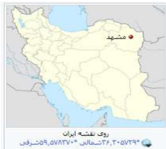
شکل (۲). موقعیت شهر مشهد بر روی نقشه ایران، ۱۴۰۱