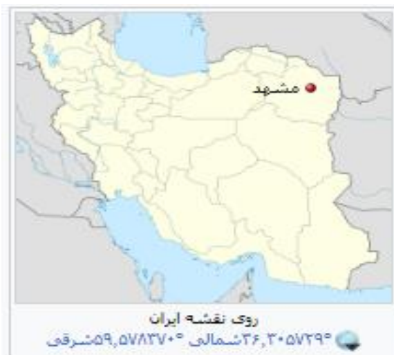
شکل (۲). موقعیت شهر مشهد بر روی نقشه ایران، ۱۴۰۱