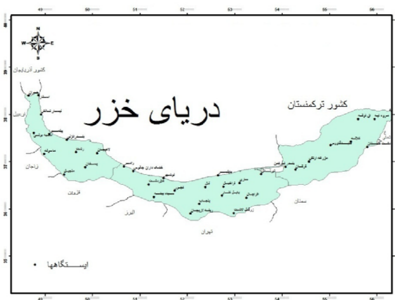
شکل (۱) نقشه پراکندگی ایستگاه‌های منطقه مورد مطالعه (شمال ایران)