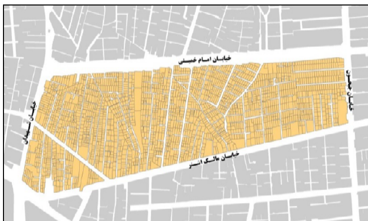
نقشه (۲) موقعیت منطقه ۱۰ در شهر تهران