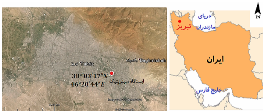
شکل (۱) موقعیت جغرافیایی منطقه و ایستگاه مربوط به اندازه‌گیری داده‌های هواشناسی

کلان شهر تبریز با وسعتی در حدود ۲۱۶۷ کیلو مربع و ۱۳۵۰ ارتفاع از سطح دریا بوده در موقعیت ۴۶ درجه و ۲۵ دقیقه شرقی، و ۳۸ درجه و ۲ دقیقه شمالی واقع شده است. در شکل ۱ موقعیت جغرافیایی منطقه و ایستگاه مورد نظر نشان داده شده است. اطلاعات هواشناسی مورد بررسی در این تحقیق شامل میزان تبخیر برحسب میلی، میانگین دمای هوا برحسب درجه سانتی‌گراد، میانگین رطوبت نسبی برحسب درصد، میانگین فشار سطح ایستگاه برحسب میلی‌بار، میانگین سرعت باد برحسب بر ثانیه، ساعات آفتابی برحسب ساعت و میزان تشعشع بر حسب ژول است که این اطلاعات به‌صورت روزانه بوده و مربوط به ایستگاه سینوپتیک تبریز می‌باشد. بازه زمانی مورد استفاده برای داده‌ها از ۱ فروردین ۱۳۸۶ الی ۱۶ آبان ۱۳۹۰ می‌باشد، که از ۱۳۳۹ رکورد ثبت شده برای آموزش و تعداد ۳۳۵ رکورد باقی مانده برای تست شبکه عصبی استفاده می‌گردد. مشخصات آماری داده‌های مورد استفاده در این تحقیق در جدول (۱) منعکس شده است.