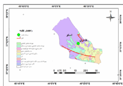
شکل (۲) محدوده زمین‌شناسی بخش مرکزی شهرستان اسکو

روستای کندوان در دامنه شمال غربی توده کوهستانی سه‌پند و در ۶۵ کیلومتری جنوب شهر تبریز در مختصات جغرافیایی 40^{\circ} و 47' و 37^{\circ} درجه شمالی و 40'' و 15' و 46^{\circ} درجه شرقی و در جنوب شهرستان اسکو واقع شده است (شکل ۱). کندوان سومین روستای صخره‌ای جهان و تنها روستای صخره‌ای است که زندگی در آن جریان دارد (آورجانی، ۱۳۸۶: ۲) بنابه نظر مقیمی اسکویی و همکاران (۱۳۸۵) قدمت مساکن سنگی کندوان به قرن هفتم هجری (قرن سیزده میلادی) و همزمان با حمله مغول می‌رسد. کندوان چایی که در دره کندوان جریان دارد، با شاخه‌های متعدد از قله‌های مرتفع سه‌پند مانند گیروداغی (۳۴۰۸ متر)، نوئورداغی (۳۱۰۰ متر)، سلطان‌داغی و غیره سرچشمه گرفته و پس از الحاق به عنصردچای با عبور از شهر خسروشهر به آجی‌چای و دریاچه ارومیه می‌ریزد. واحد کوهستان در این منطقه از داسیت‌های میوسن و پلیوسن تشکیل شده است، رسوبات آتشفشانی و سنگ‌های آذرآوری (شامل توف، ماسه سنگ، سیلستون و کنگلومرا) بیش‌تر مساحت این منطقه را در بر گرفته‌اند روستای کندوان نیز بر روی این تشکیلات استقرار دارد. (کرمی، ۱۳۸۶: ۱۱۸). توده سنگ خانه‌های سنگی روستای کندوان از رسوب مواد آتشفشانی مانند توف و خاکستر تشکیل شده است که این مواد منفصل در کنار هم قرار گرفته و توده سنگ ضعیف کندوان را به‌وجود آورده (پیرمحمدی، ۱۳۹۰: ۳۱) (شکل ۲). براساس روش اقلیم‌نمای آمبرژه اقلیم منطقه مورد نظر نیمه‌خشک و سرد است.