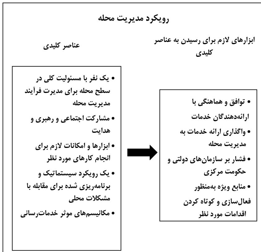
شکل (۱) رویکرد مدیریت محله، منبع: Neighborhood Renewal Unit, 2006, 7

نقاط قوت خود را تقویت کرده و به مقابله با چالش‌های جدید بپردازند ( Report of the ) (Local Services and Community Safety, 2011: 7).