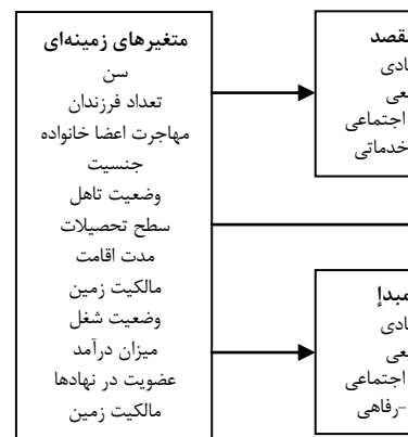
شکل (۱) مدل مفهومی پژوهش

فرآیندی است که به تصمیم افراد و ارزیابی آنها از شرایط موجود در مقصد (جاذبه) و پیچیدگی و سختی‌های کنونی محل زندگی (دافعه) بستگی دارد. بنابراین ویژگی‌های شخصی مانند سن، جنس، سطح سواد، حدود خودتکایی، همبستگی قومی و نژادی را نیز باید از موارد موثر بر مهاجرت به شمار آورد (زنجانی، ۱۳۸۰: ۲۰۱). در انجام پژوهش حاضر تأثیر جاذبه‌های مقصد و دافعه‌های کوچ در کنار ارزیابی میزان تأثیر متغیرهای اجتماعی اقتصادی مانند سن، تعداد فرزندان، مهاجرت اعضا خانواده، جنسیت، وضعیت تاهل، سطح تحصیلات، مدت اقامت، مالکیت زمین، وضعیت شغل، میزان درآمد، عضویت در نهادها و مالکیت زمین بر گرایش به مهاجرت در بین خانوارهای روستایی شهرستان زابل بررسی می‌شود. بنابراین، مدل مفهومی پژوهش حاضر در شکل (۱) ارائه شده است.