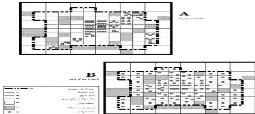
شکل شماره (۱): تمرکز

- تمرکز: تمرکز درجه‌ای است که توسعه به‌جای اینکه در کل ناحیه پراکنش عادلانه داشته باشد به‌طور نامناسب تنها در فضاهای محدودی از کل ناحیه شهری واقع شده است. (زنگنه، ۱۳۸۷:۱۷)