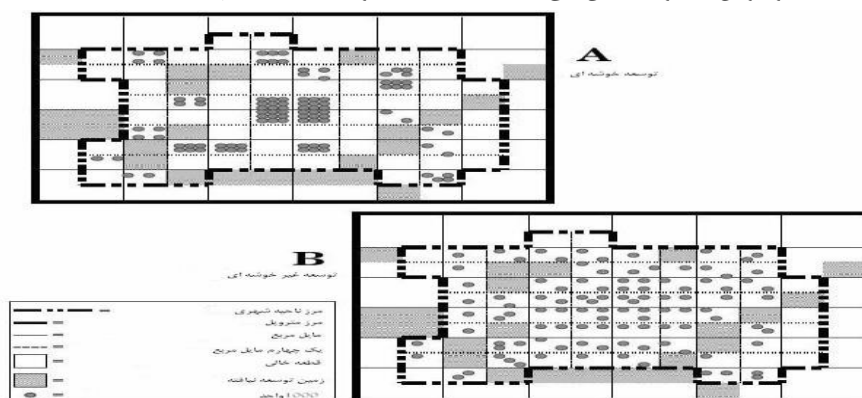
شکل شماره (۳): خوشه‌بندی

- خوشه‌بندی: در چه ای است که توسعه به‌طور فشرده طبقه‌بندی شده تا مقدار زمین در هر مایل مربع از سرزمین‌های قابل توسعه که به‌وسیله کاربری‌های مسکونی یا غیرمسکونی اشغال می‌شود، به حداقل برسد. (همان: ۶۹۱). تصویر شماره ۳ مجموعه بندی را با یک مقدار توسعه در دو روش متفاوت نشان می‌دهد A از B مجموعه بندی بیشتری دارد.