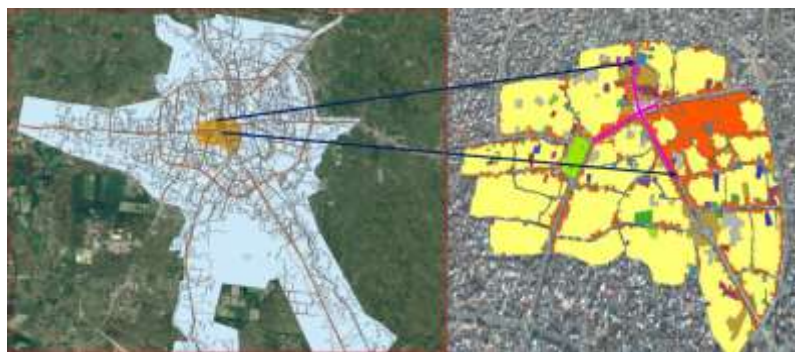
شکل ۱: موقعیت محدود مورد مطالعه

شهرداری و بخشی از خیابان‌های شریعتی و سعدی می‌باشد. بیش از احداث پیاده راه، این محدوده از شلوغ‌ترین و پرتراфик‌ترین نقاط شهر بوده و شهروندان همواره با حجم عظیم خودرو در خیابان‌های منتهی به میدان مواجه بودند. وجود مراکز اداری و تجاری در این منطقه، موجب ازدحام جمعیت در ساعات مختلف روز بوده و تداخل حرکت و سواره اختلال در حرکت و جابجایی ایجاد می‌گردد. مشکلات ترافیکی و پیامدهای حاصل از آن در ابعاد گوناگون ضرورت تحول در سیستم حمل‌ونقل منطقه را تأکید می‌نمود و احداث پیاده راه در این محدوده پاسخی در جهت حل این معضل بود. به دنبال ضرورت تحول در این منطقه، پیاده راه فرهنگی اجرا شد و به بهره‌برداری رسید. این پروژه علاوه بر حل مشکلات حمل‌ونقلی می‌تواند در تغییر نگرش ترافیکی جامعه نیز اثرگذار بوده و عاملی برای تشویق شهروندان به پیاده‌روی باشد. با اجرای این پروژه و حذف اتومبیل از این محدوده، محیطی ایمن و عاری از آلودگی صوتی برای مردم ایجاد شده که می‌تواند محلی برای گذران اوقات فراغت، خرید و فرصتی در جهت ایجاد تعاملات اجتماعی افراد باشد. این مکان به عنوان حوزه‌ای امن می‌تواند مکانی برای اجتماع تمامی گروه‌های سنی جامعه هم چون کودکان، سالمندان و حتی افراد ناتوان حرکتی باشد. این پیاده راه به‌عنوان بستری برای رویدادهای هنری و فرهنگی مانند سخنرانی خیابانی، تئاتر و موسیقی و ... به‌خوبی کار می‌کند و در مناسبت‌های مختلف مراسم متنوعی در آن برگزار می‌گردد. از این رو پیاده راه می‌تواند عاملی برای ایجاد نشاط و سرزندگی اجتماعی باشد (مبصر و شاه وردی، ۱۳۹۵: ۵).